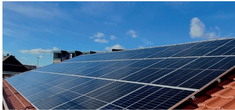
Wohnhaus in Reutlingen

Leistung PV: 16,40 kWp; Speicherkapazität 10 kWh