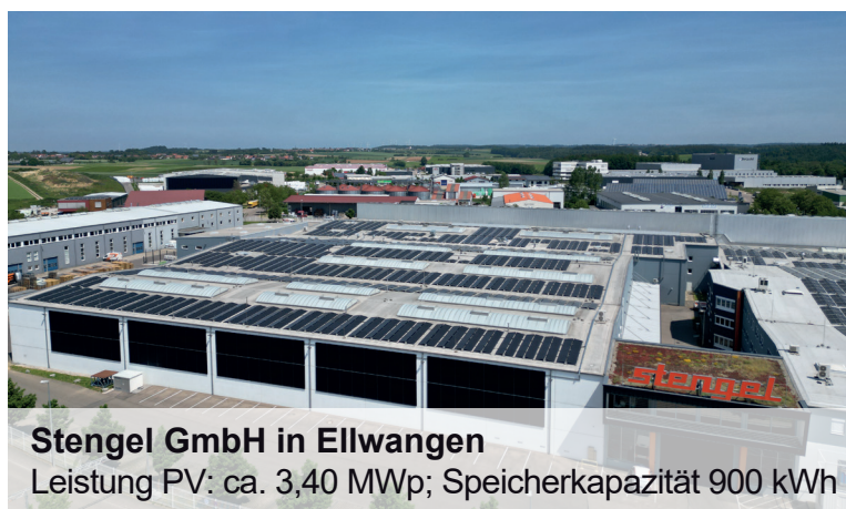
Stengel GmbH in Ellwangen

Leistung PV: 15,39 kWp; Speicherkapazität 10 kWh