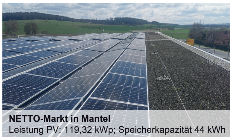
NETTO-Markt in Mantel

Leistung PV: ca. 3,40 MWp; Speicherkapazität 900 kWh