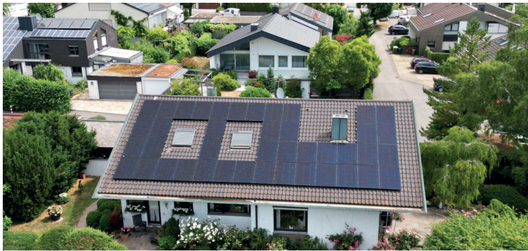
Wohnhaus in Ditzingen

Leistung PV: 16,40 kWp; Speicherkapazität 10 kWh