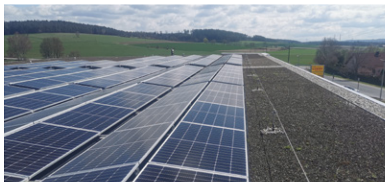
NETTO-Markt in Mantel

Leistung PV: ca. 3,40 MWp; Speicherkapazität 900 kWh