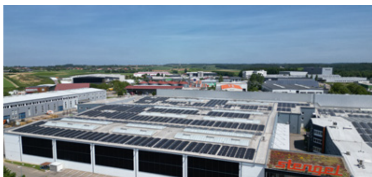
Stengel GmbH in Ellwangen

Leistung PV: 15,39 kWp; Speicherkapazität 10 kWh